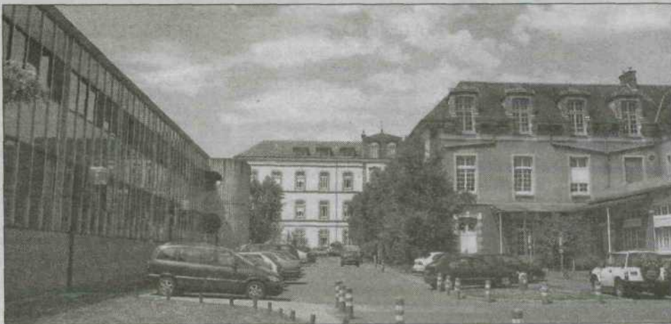
L'actuel hôpital de Fontainebleau avec, à droite, les anciens bâtiments

Frédéric Valletoux se livre pour nous à cette analyse : « L'envie de coopération est d'autant plus sincère de part et d'autre que chacun y reconnaît ses propres intérêts ainsi que ceux du sud du département ! Il ne s'agit pas de reconstruire l'hôpital de Fontainebleau sur les terrains du Bréau sans se préoccuper d'unir efficacement nos forces ! Non, il fallait prendre aussi en compte les spécificités de chacun. Nous avons définitivement tourné le dos aux fausses et illusives logiques de fusion ou d'absorption. Tous veulent coopérer, aussi bien les représentants des médecins que les maires concernés. Nemours s'est dit d'accord pour favoriser